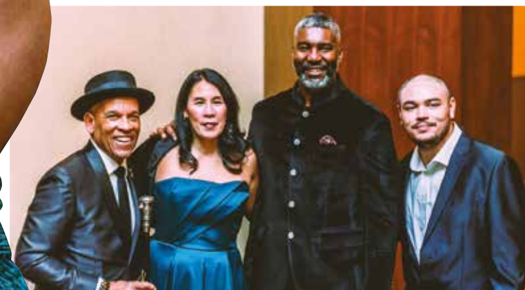
Para obtener más información sobre la Asociación TAG Inc. y El Jolgorio Navideño, visite www.jolgorio.org

Reserve la fecha para el Jolgorio Navideño del próximo año el 7 de diciembre de 2024, mientras la Asociación TAG Inc. continúa con su misión de crear una comunidad latina unida, educada y empoderada