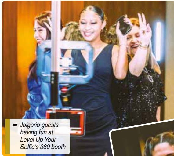
Jolgorio guests having fun at Level Up Your Selfie's 360 booth