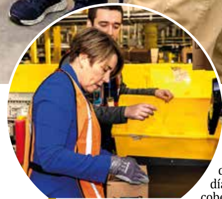
► Governor Healey learning how to package a customer package.

Además de un salario promedio por hora de $20,50, Amazon ofrece a todos los empleados una variedad de excelentes beneficios que apoyan a los empleados y a los familiares elegibles, incluidas las parejas de