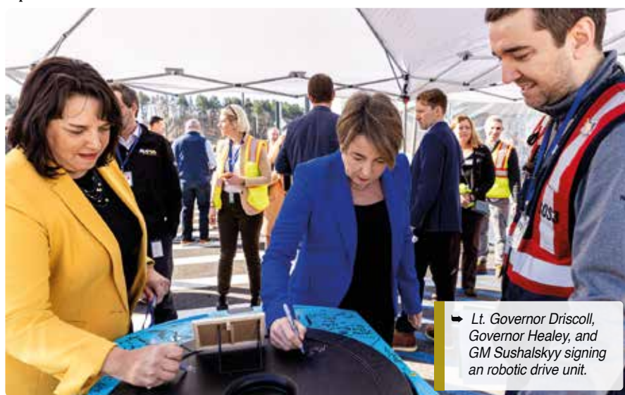
► Lt. Governor Driscoll, Governor Healey, and GM Sushalsky signing an robotic drive unit.

En el primer piso, los trabajadores descargan cajas de mercancías de los camiones y desempacan todos los artículos en contenedores amarillos que luego se envían a uno de los cuatro pisos superiores. En cada piso de almacenamiento, un vasto espacio central está vallado como dominio de los robots Hércules de Amazon.