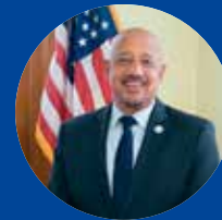
Mayor Brian A. DePeña