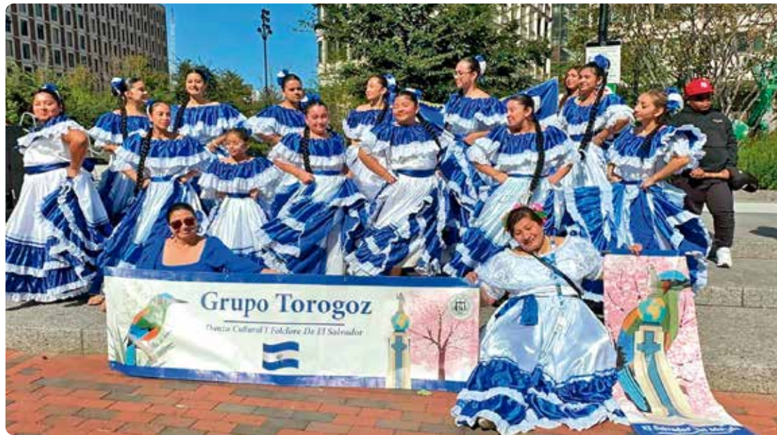
Los Mascaros, Grupo Torogoz, Convite de Guatemala, y Swaby's Taekwondo Panamá.