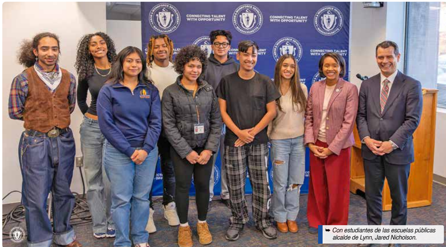
Con estudiantes de las escuelas públicas alcalde de Lynn, Jared Nicholson.