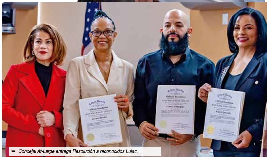
→ Concejal At-Large entrega Resolución a reconocidos Lulac.

¡Nos vamos de vacaciones! La Hora del Café REGRESA AL AIRE MARTES 6 DE ENERO 7am-8am Por las redes sociales