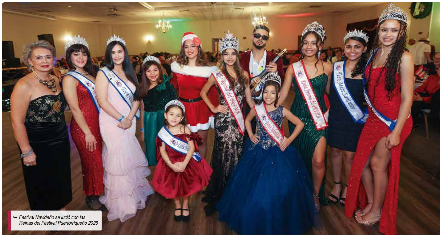
➔ Festival Navideño se lució con las Reinas del Festival Puertorriqueño 2025