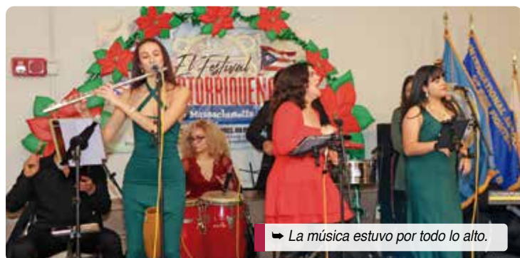
➔ La música estuvo por todo lo alto.