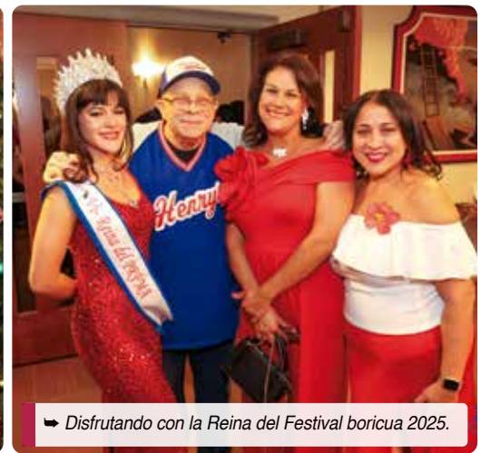
» Disfrutando con la Reina del Festival boricua 2025.