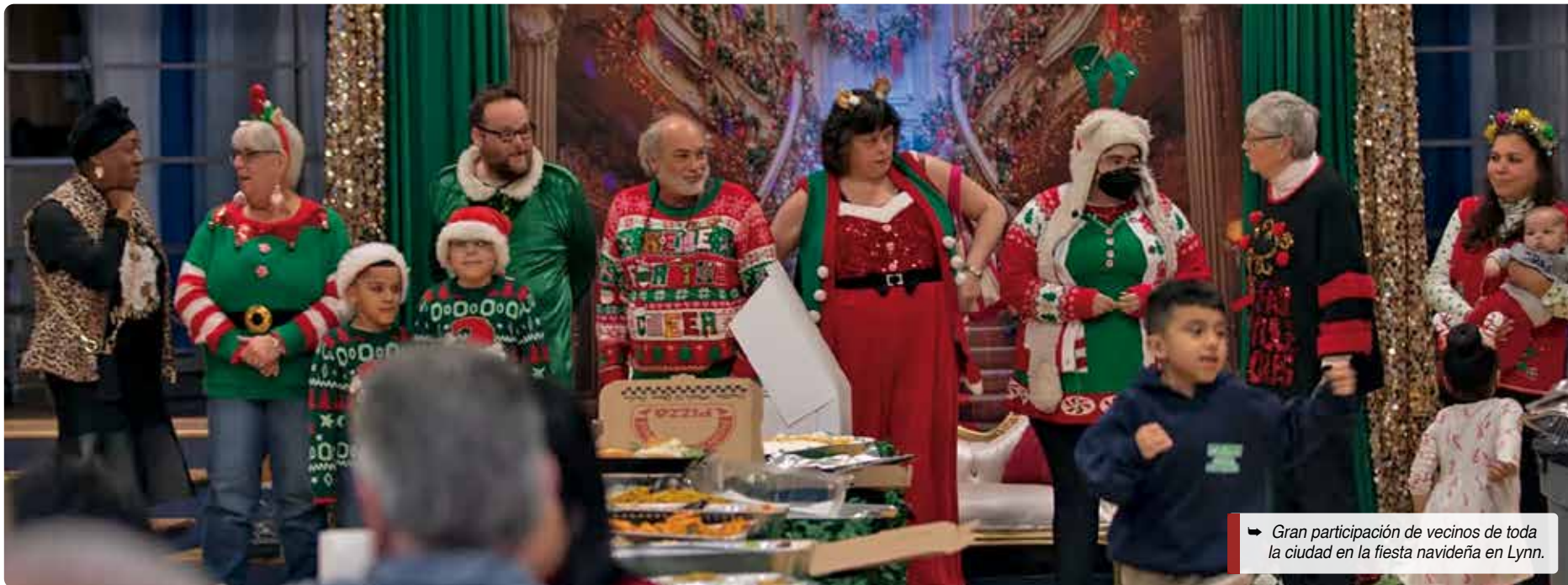
➔ Gran participación de vecinos de toda la ciudad en la fiesta navideña en Lynn.