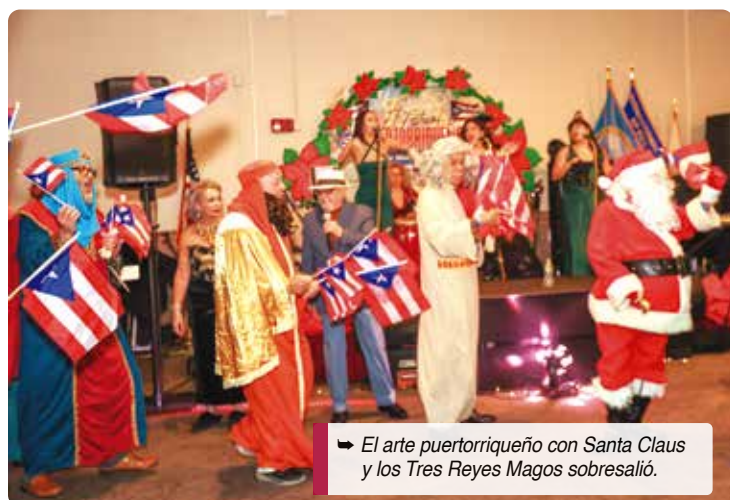
➔ El arte puertorriqueño con Santa Claus y los Tres Reyes Magos sobresalió.