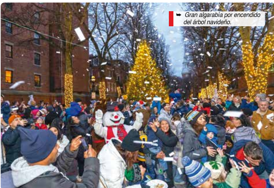
Gran algarabía por encendido del árbol navideño.