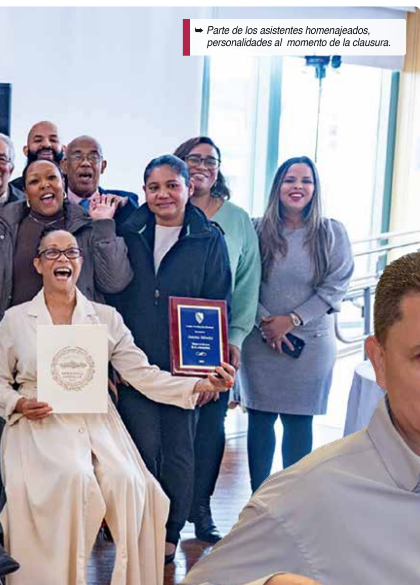
→ Parte de los asistentes homenajeados, personalidades al momento de la clausura.