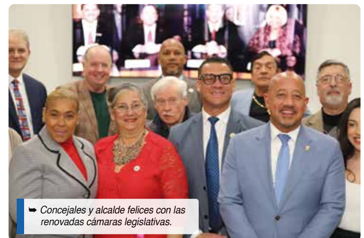
Concejales y alcalde felices con las renovadas cámaras legislativas.