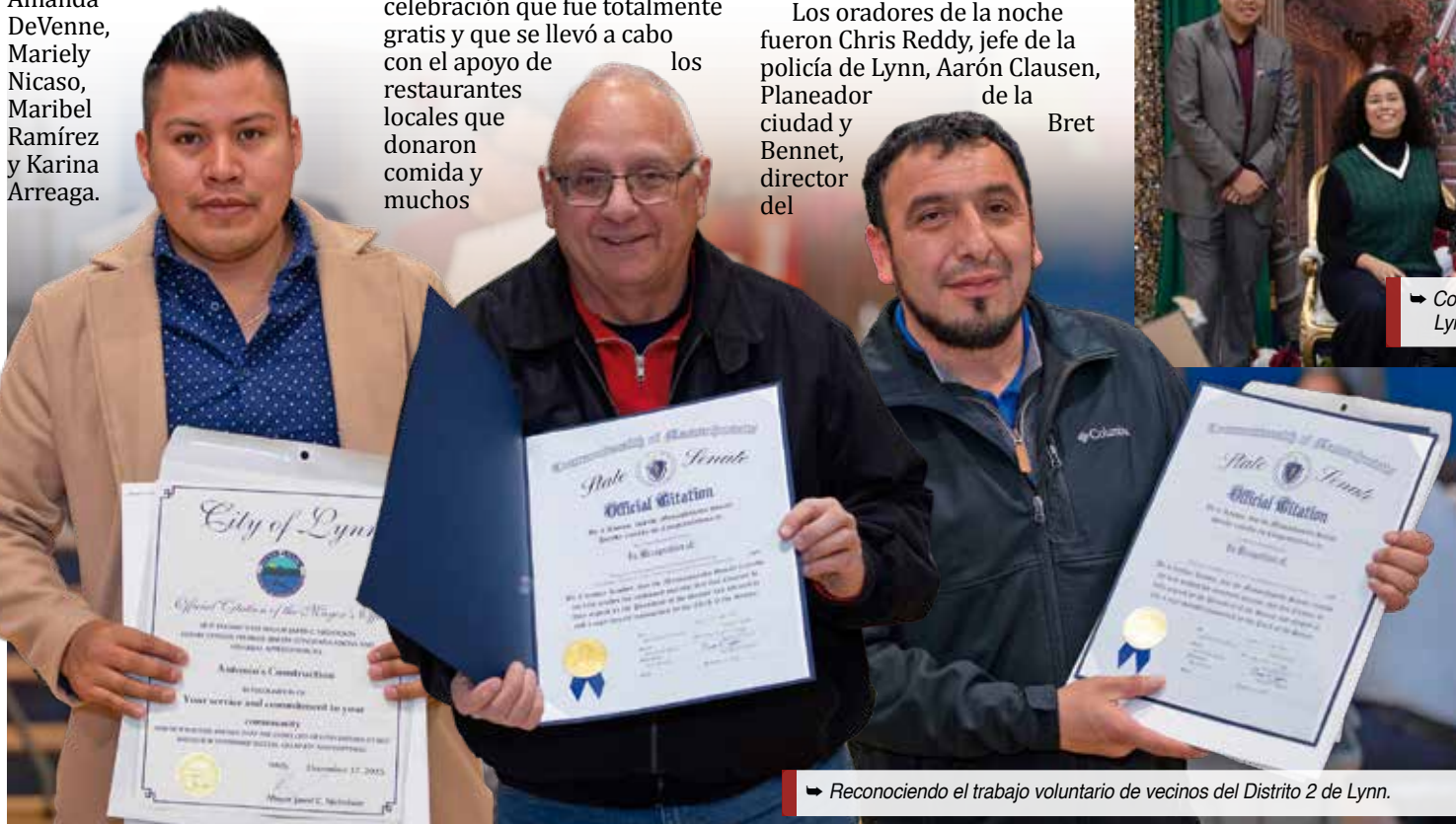
➔ Reconociendo el trabajo voluntario de vecinos del Distrito 2 de Lynn.