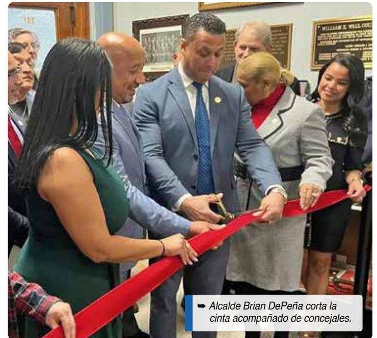
Alcalde Brian DePeña corta la cinta acompañado de concejales.