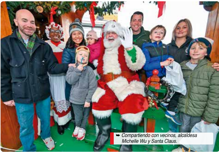
Compartiendo con vecinos, alcaldesa Michelle Wu y Santa Claus.