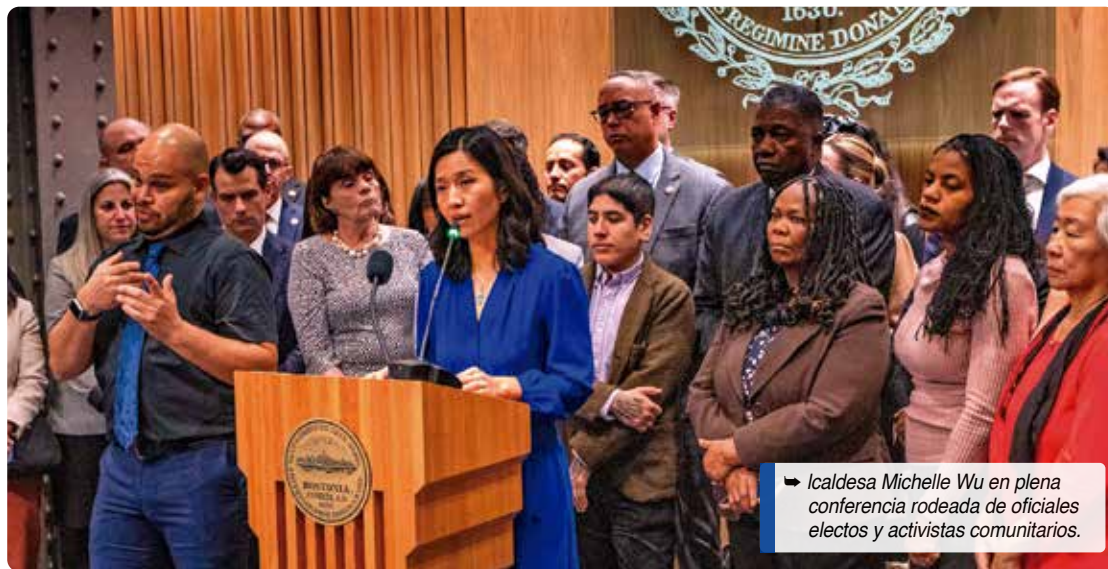
Alcaldesa Michelle Wu en plena conferencia rodeada de oficiales electos y activistas comunitarios.