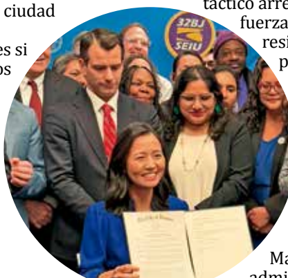
Alcaldesa muestra una de sus acciones ejecutivas.