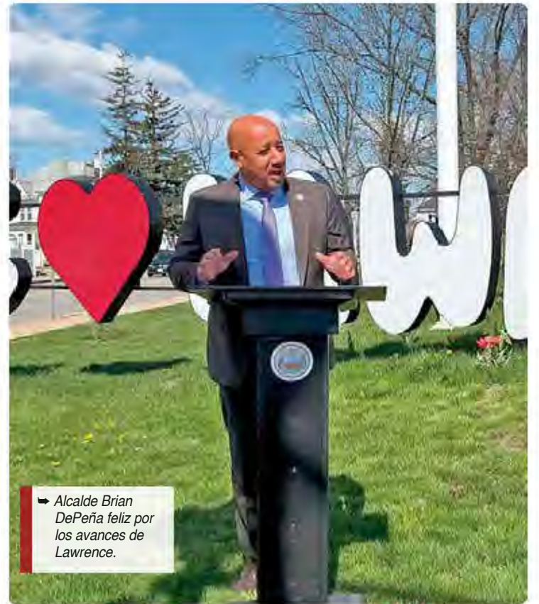
Alcalde Brian DePeña feliz por los avances de Lawrence.

formalmente la adjudicación de aproximadamente $1.2 millones en fondos federales destinados a trabajos de reparación y restauración parciales de los puentes Joseph W. Casey y Daisy Street, dos importantes infraestructuras críticas que sirven diariamente a residentes y viajeros de toda la ciudad.