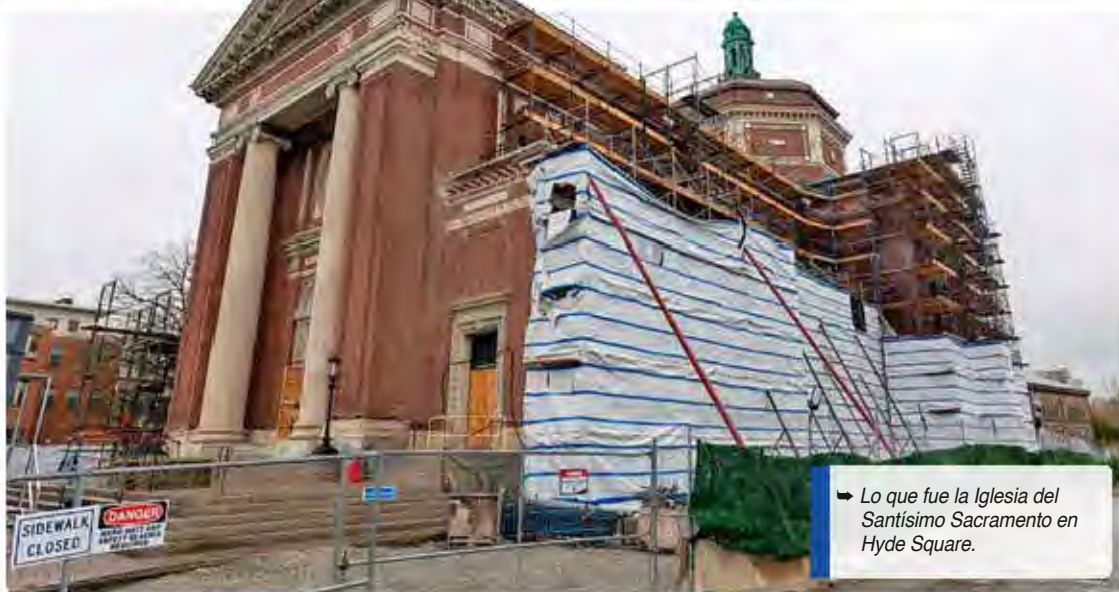
Lo que fue la Iglesia del Santísimo Sacramento en Hyde Square.