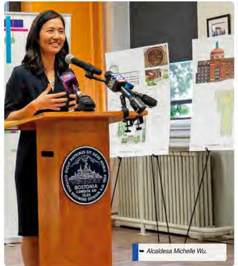
Alcaldesa Michelle Wu.

remodelada y con una superficie de 6,500 pies cuadrados— como un espacio multiusos para espectáculos, destinado a jóvenes y artistas afrolatinos, y como un centro cultural para el Barrio Latino de Boston. Este espacio albergará programas artísticos juveniles, talleres, actividades extraescolares, eventos comunitarios, ensayos y espectáculos en vivo, tanto para los participantes de los programas como para los residentes del vecindario.