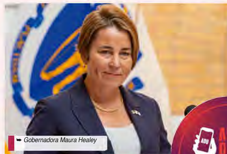
Gobernadora Maura Healey

vicegobernadora Kim Driscoll se unieron a líderes sindicales nacionales y locales para celebrar la creación de este nuevo hito: el App Drivers' Union. El sindicato fue certificado por el Departamento de Relaciones Laborales de Massachusetts, lo que marca la mayor victoria de negociación colectiva en el sector privado desde la década de 1940 y constituye