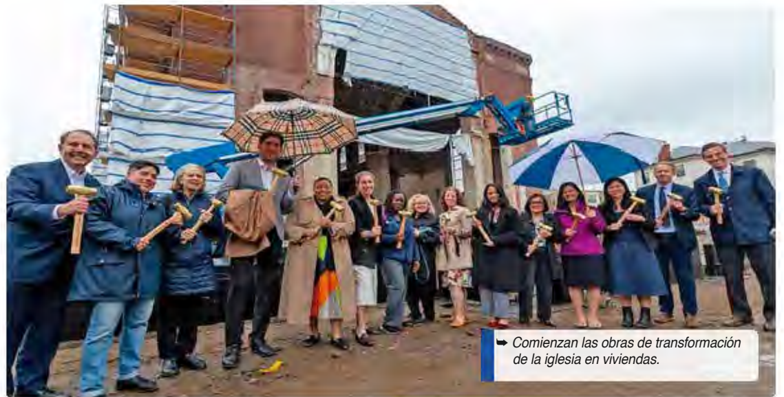
Comienzan las obras de transformación de la iglesia en viviendas.

vivienda asequible. “Gracias a todos nuestros socios y organizaciones comunitarias que están impulsando esta labor fundamental”, según dijo la alcaldesa Wu.