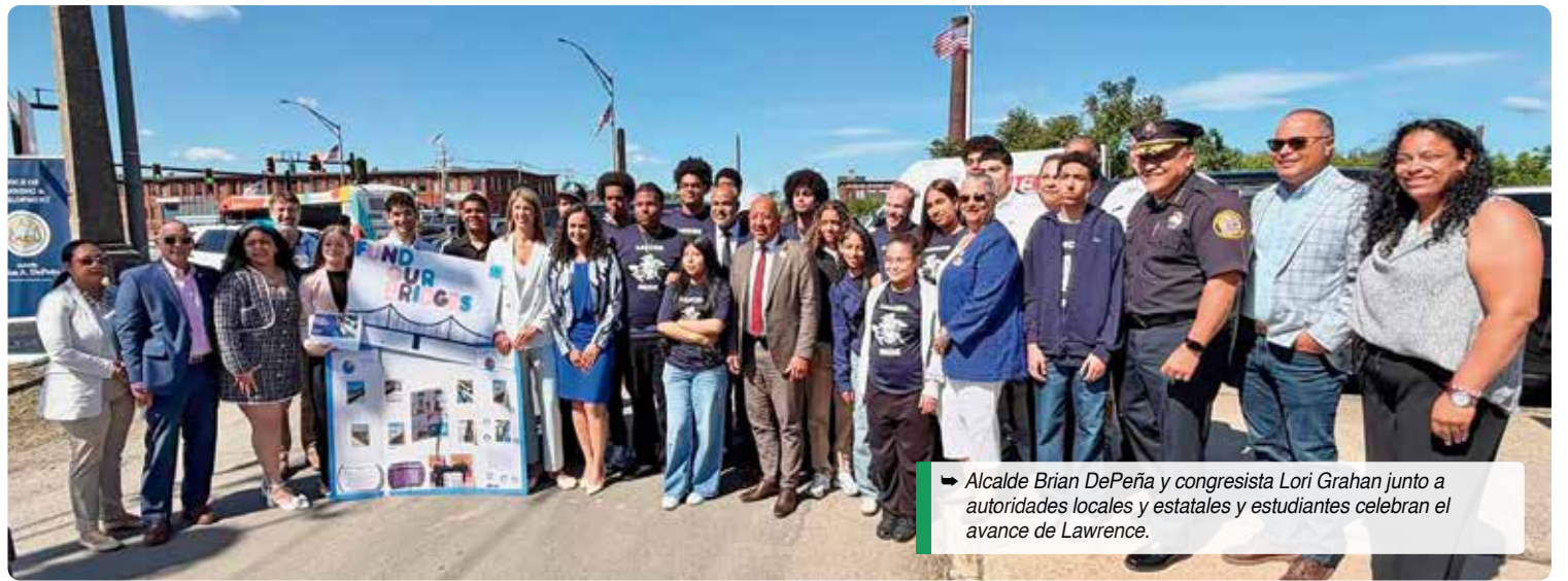
→ Alcalde Brian DePeña y congresista Lori Trahan junto a autoridades locales y estatales y estudiantes celebran el avance de Lawrence.

“Estos fondos reflejan el poder del compromiso cívico y la defensa comunitaria, incluyendo las voces y esfuerzos