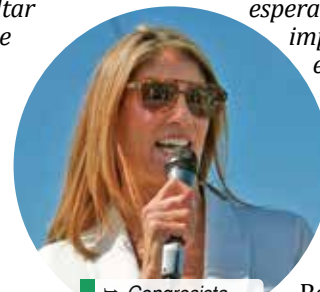
→ Congresista Lori Trahan.

de estudiantes locales que ayudaron a resaltar la importancia de estas mejoras de infraestructura necesarias desde hace muchos años”, dijo el alcalde DePeña, agradeciendo a la congresista Trahan por su colaboración y apoyo, así como a los Representantes Estatales Frank Moran y Estela Reyes.