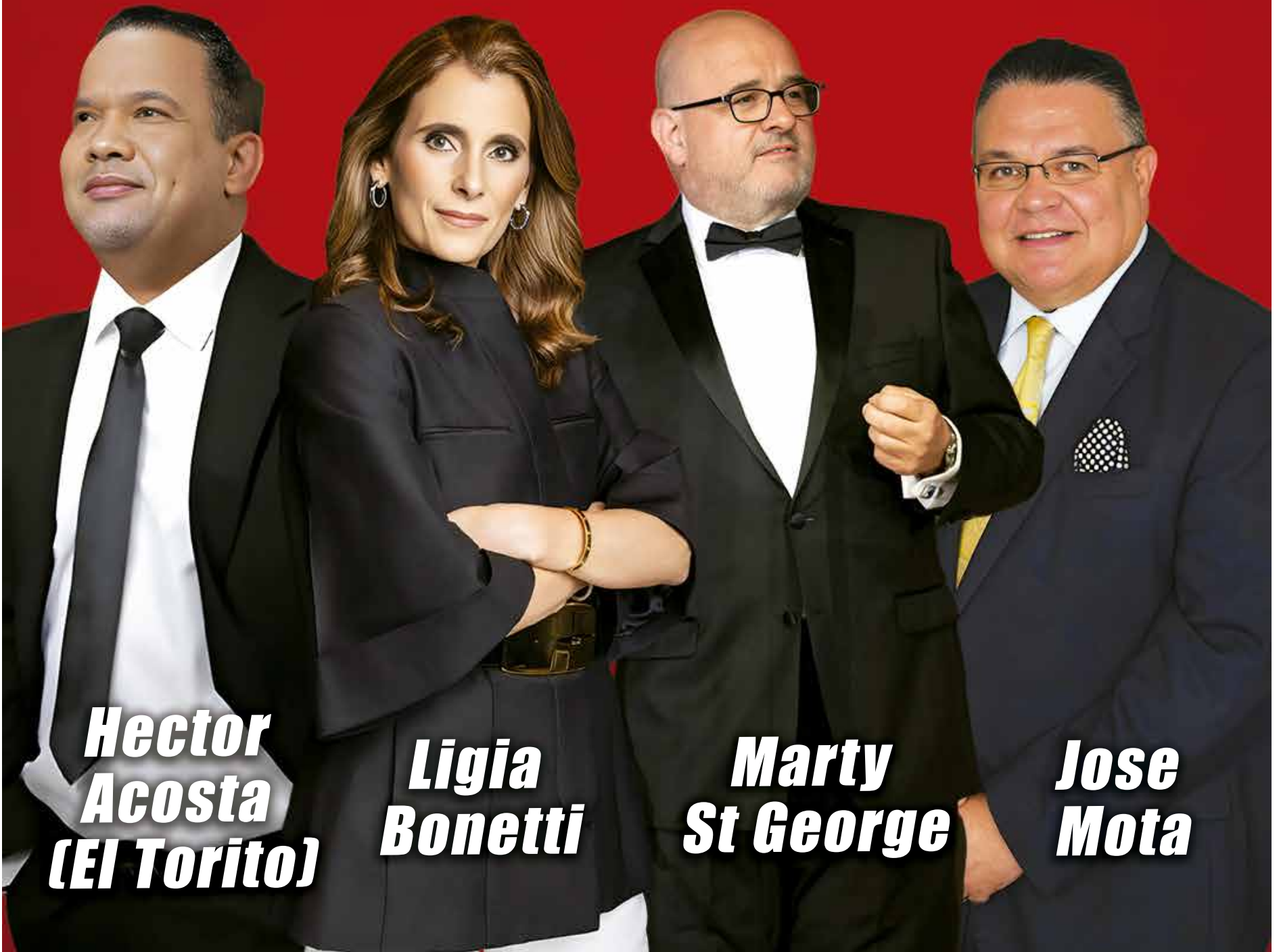
Hector Acosta (El Torito)