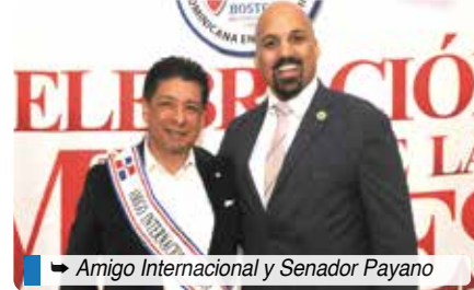
Amigo Internacional y Senador Payano