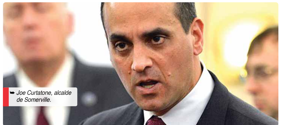
Joe Curtatone, alcalde de Somerville.

Los residentes de Boston deben verificar si son elegibles para el estímulo antes de llamar a https://www.bostontaxhelp.org/stimulus-payment-help/ . Se puede acceder a la línea directa llamando al (781) 399-5330 o al 311. La línea directa está abierta los lunes, miércoles y viernes a partir de las 2 p.m. - 5 p.m., y las llamadas recibidas fuera de esos horarios serán devueltas. El personal está disponible para ayudar a los residentes en español, y los residentes que necesiten asistencia en otros idiomas se conectarán a los servicios de traducción apropiados.