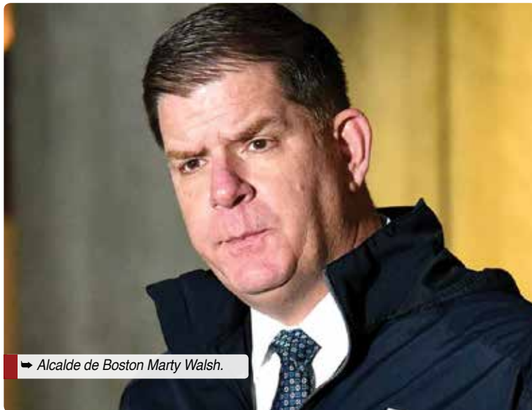
Alcalde de Boston Marty Walsh.

Boston continuará satisfaciendo las necesidades de las familias, las personas de la tercera edad y las pequeñas empresas, además de seguir la orientación científica y de