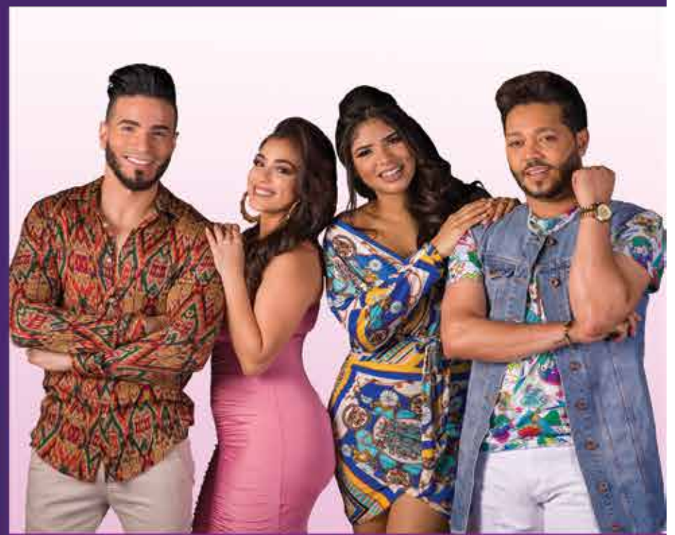
SANDY XANIE GRECTSY EMILDO