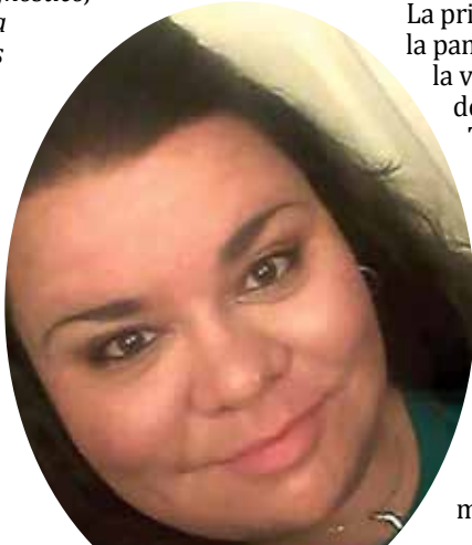
Una de las maestras muertas por COVID-19.