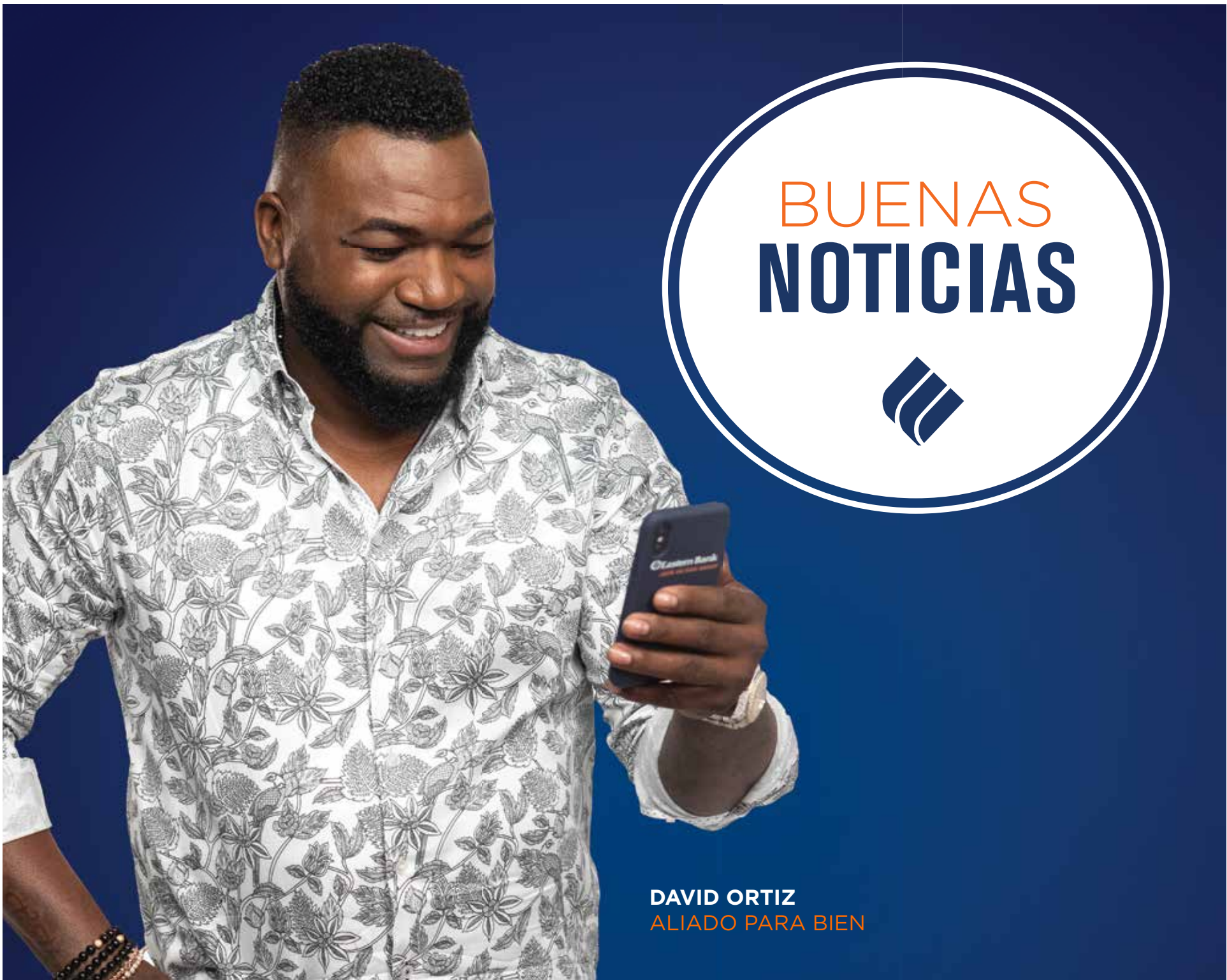
DAVID ORTIZ ALIADO PARA BIEN