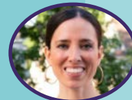
SONIA CHANG-DIAZ Senadora Estatal