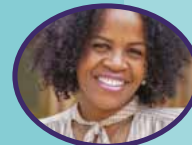
KIM JANEY Alcaldesa de Boston