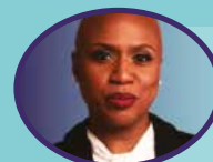
AYANNA PRESSLEY Congresista