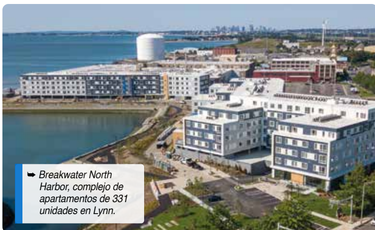
► Breakwater North Harbor, complejo de apartamentos de 331 unidades en Lynn.

viviendas, incluido un aumento del límite en el Programa de