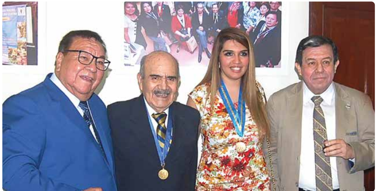
derechos a la libertad de expresión”.

“El Perú no es una isla, tampoco es un islote, somos parte de una comunidad global y hoy cuando se pone en riesgo la libertad de expresión, el aporte o los aportes de los colegas que viven en los Estados Unidos o en otras partes del mundo son sumamente valiosos porque desde el exterior van a ser los que auspicien y protejan los