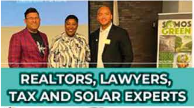
REALTORS, LAWYERS, TAX AND SOLAR EXPERTS