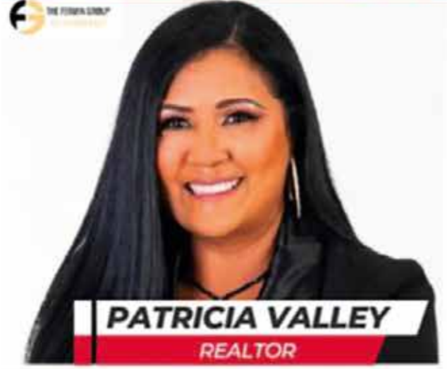
PATRICIA VALLEY REALTOR