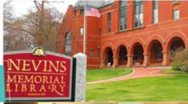
NEVINS MEMORIAL LIBRARY