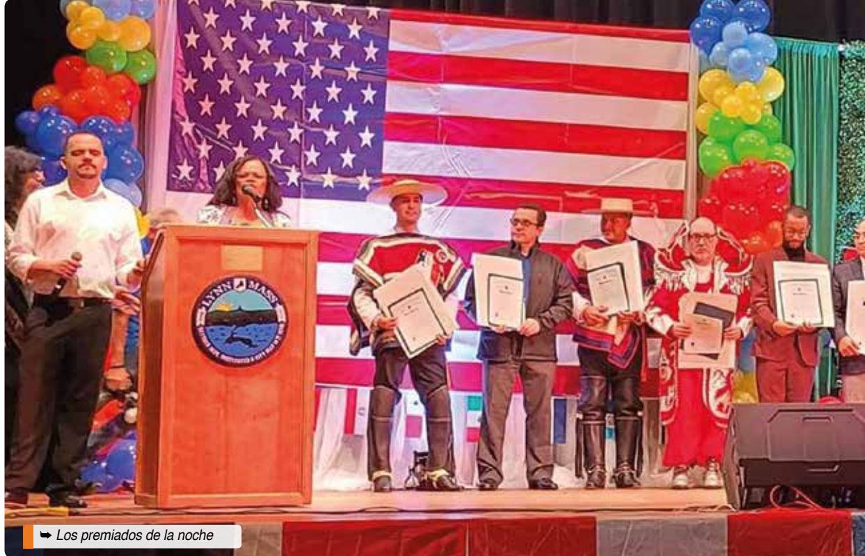
Los premiados de la noche